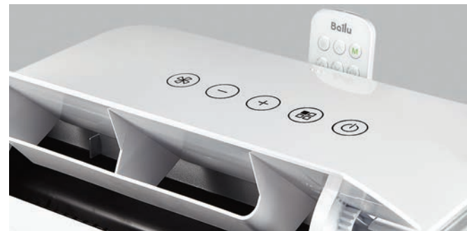
Работа на охлаждение и обогрев