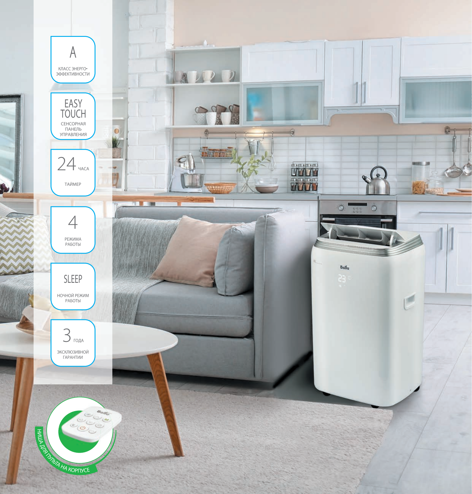
Автоматические жалюзи и сенсорная панель управления